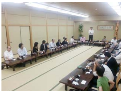
裁判傍聴終了。正木屋にて昼食