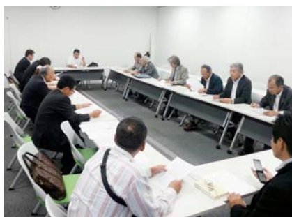
千葉県弁護士会館4F大会議室集合